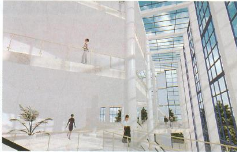
İLLÜSTRASYON: GÖKHAN KOŞEOĞLU