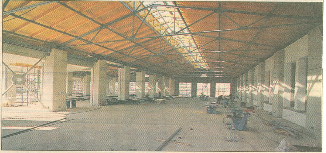
Çağdaş Sanatlar Müzesi'nin iç mekânları projeye göre yukarıdaki gibi.

Bu noktadan itibaren iki sorunla karşılaşmıştı. Birinci sorun ödenek sorunuydu. İkinci sorun Bayındırlık Bakanlığı'nın, Cumhurbaşkanlığı Senfoni Orkestrası yeni binasının bu arazide yer alacağı gerekçesiyle, söz konusu cer atölyelerinin tamamen yıkılmasını Kültür Bakanlığı'nca Milli Komite'ye önerilmesini istemesiydi. Kültür Bakanlığı cer atölyesinin korunmasından yana olan tutumunu değiştirmede. İkinci sorunun çözülmesi zor olmadı,