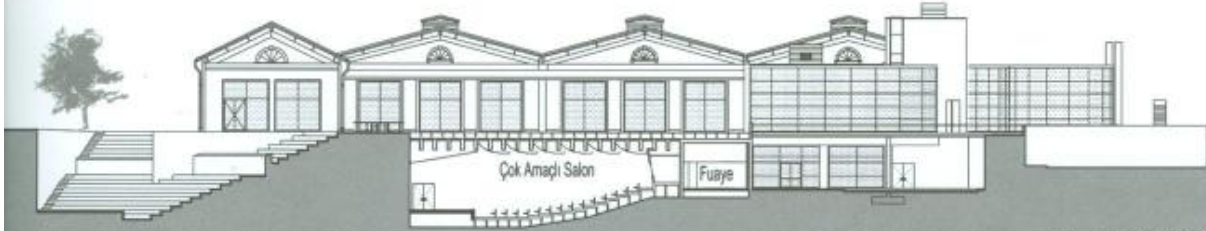
A - A Kesit / Görünüşü