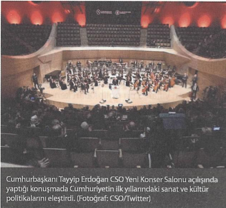
Cumhurbaşkanı Tayyip Erdoğan CSO Yeni Konser Salonu açılışında yaptığı konuşmada Cumhuriyetin ilk yıllarındaki sanat ve kültür politikalarını eleştirdi.