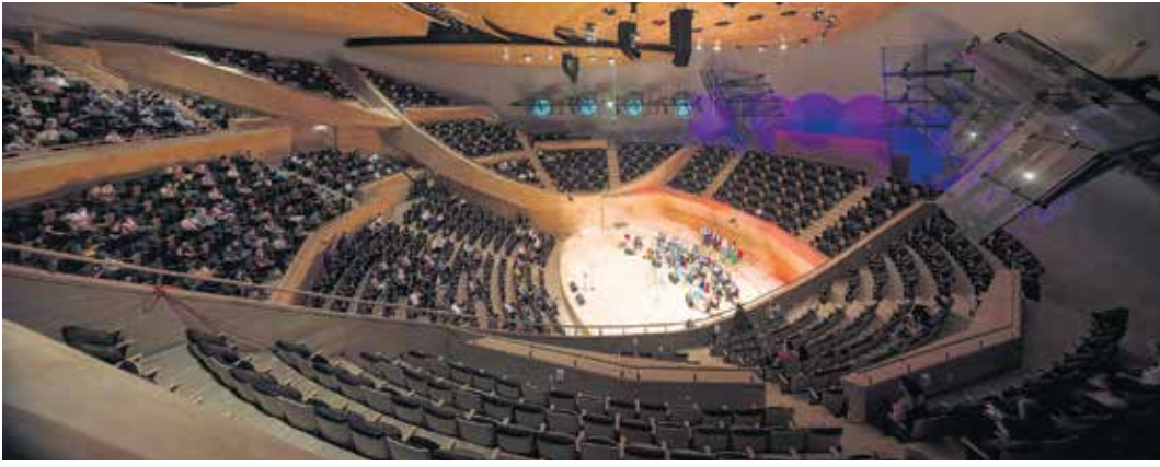
Atatürk Kültür Merkezi Cumhurbaşkanlığı Senfoni Orkestrası Konser Salonu (CSO Ada Ankara)