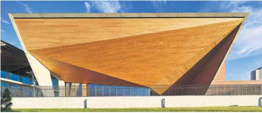
TED Ankara Koleji Sahne Sanatları Gösteri Merkezi

da jüri aracılığı ile yapıyor Mimarlar Odası. Onun için de çok önemli bir görev olduğunu düşünüyorum. Seçilip seçilmemesi, sergiye alınıp alınmaması çok önemli değil ama ülkenin genel durumunu doğru değerlendirip bunu lanse etmek, göstermek önemli. O nedenle jürinin bunu fark etmesi gerekirdi. Tip okullar, daha doğrusu tip yapı yapmak mimarlık dışı bir tavır. Biz yıllarca bunun mücadelesini verdik ve bekledik ki bu mücadeleye Mimarlar Odası da el versin. O eli göremeyince doğrusunu isterseniz biraz hayal kırıklığı oluştu ve haklı olarak demoralize olduk.