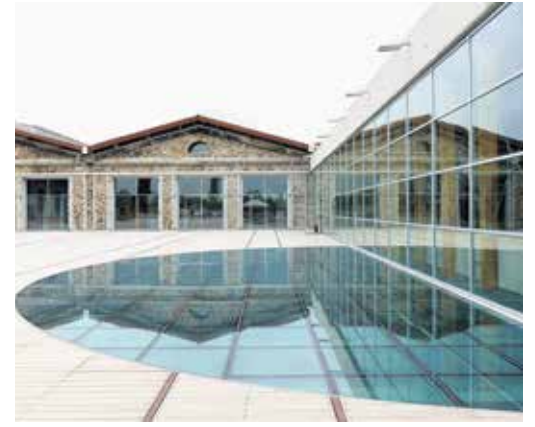
CER Modern Sanatlar Merkezi

Günümüzde başka türlü iyi mimarlık yapmak mümkün olmuyor malesef.